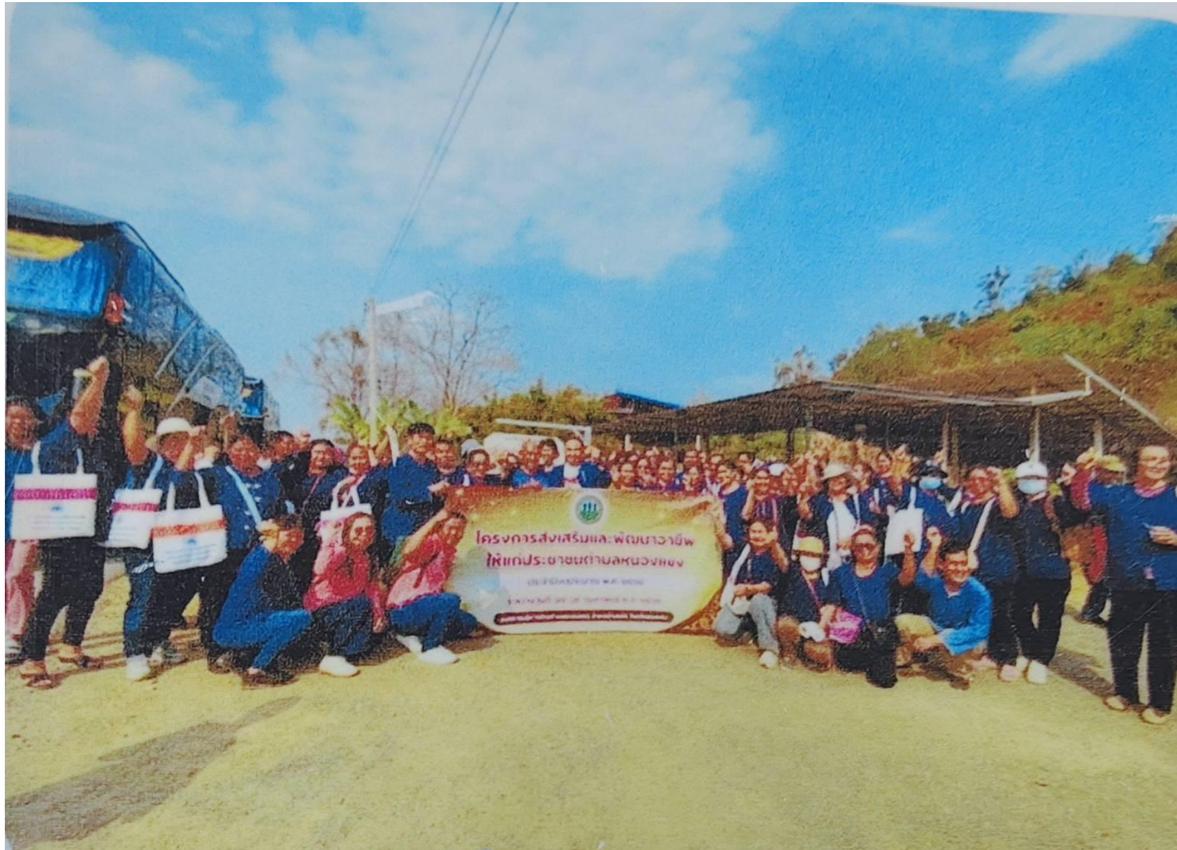
ภาพประกอบโครงการฝึกอบรมและศึกษาดูงาน เมื่อวันที่ ๑๗-๑๙ กุมภาพันธ์ ๒๕๖๘ ณ อำเภอเชียงคาน จังหวัดเลย