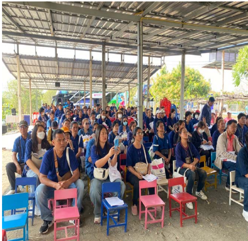
โครงการส่งเสริมและพัฒนาอาชีพให้แก่ประชาชนตำบลหนองแสง